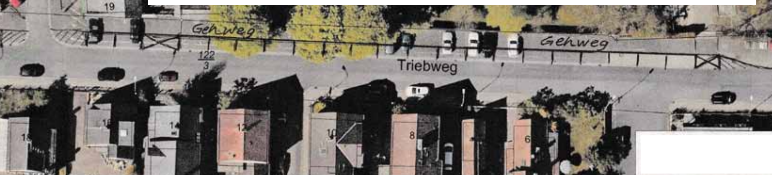
Weitere Parkplätze gibt es Richtung Triebweg und Tennisanlage

Auch Appelle an das christliche Ethos für die Schwächeren in der Gesellschaft und im Straßenverkehr konnten die CDU nicht auf den rechten Wallfahrtsweg bringen. Gegen die Stimmen von BFH, SPD und Grünen wurde der Vorschlag, die Autos parallel zur Straße zu platzieren und einen breiten Gehweg entlang der Mauer des Germaniasportplatzes zu markieren, abgelehnt.