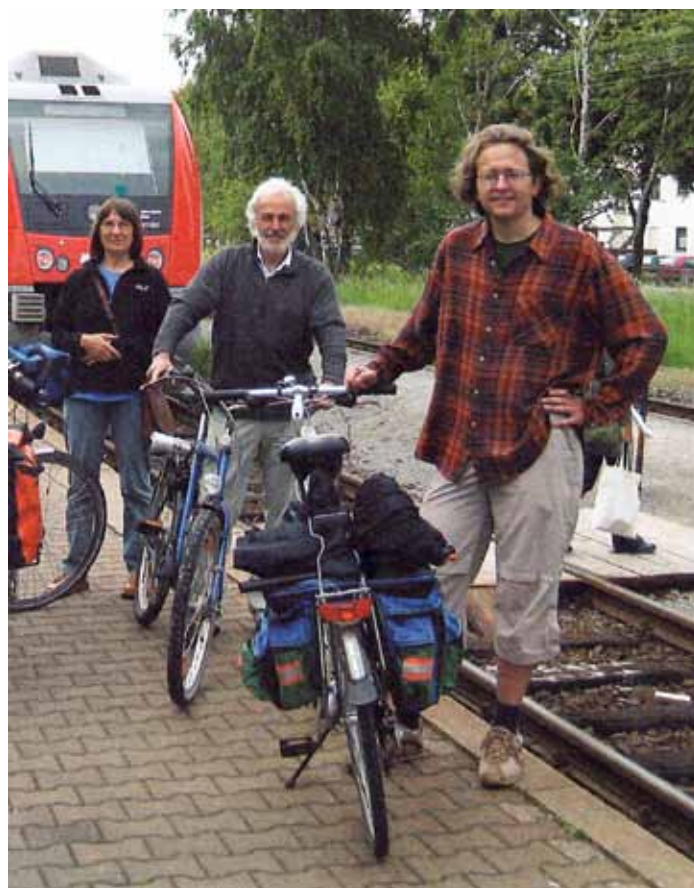
Am Bahnhof Hainstadt 2009, vor der Modernisierung der Odenwaldbahnstrecke, ohne Unterführung und Bahnsteigerneuerung

Wenn die Bahngleise in Hanau auf der Westseite alle erneuert sind, werden die Bedienungszeiten auch wieder pünktlicher gewährleistet werden können. Die große Lösung für mehr Pünktlichkeit wird erst der zweigleisige Ausbau ab Bahnhof Hainstadt Richtung Seligenstadt bringen (für die NutzerInnen in Hainburg, Seligenstadt und vor allem Zellhausen!), der aber erst noch geplant und finanziert werden muss.